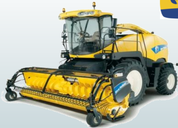
Self Propelled Forage Harvesters