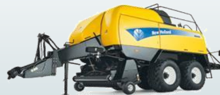
Large Square Balers